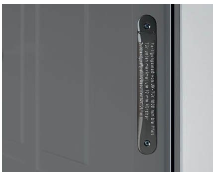
GEPRÜFTE QUALITÄT KENNZEICHNUNG DURCH PRÜFPLAKETTEN