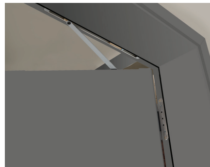
OBENTÜRSCHLIESSER (OTS) (GLEITSCHIENEN-TÜRSCHLIESSER OPTIONAL)